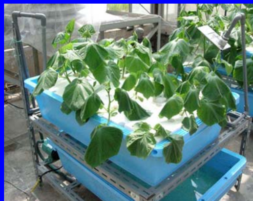
バクテクリーンAGフィルター設置区のキュウリは健全に生育(左)。 無処理区では発病が見られる(右)

濾過処理した養液から病原菌は殆ど検出されない(上段)が無処理区では多く繁殖している(下段)。